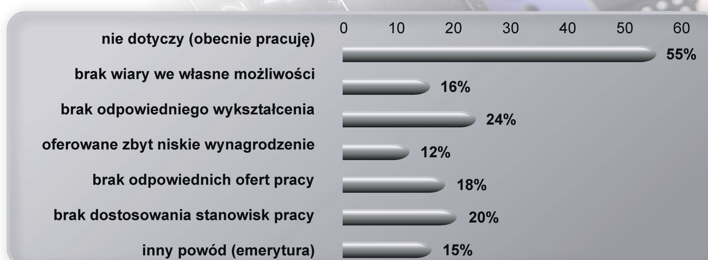
Wykres 1. Przyczyny pozostawania poza zatrudnieniem