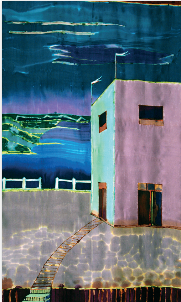
Dom II, 2012, jedwab 175x112