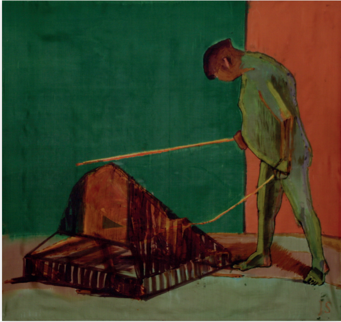
Treser, 2012, jedwab 107x111