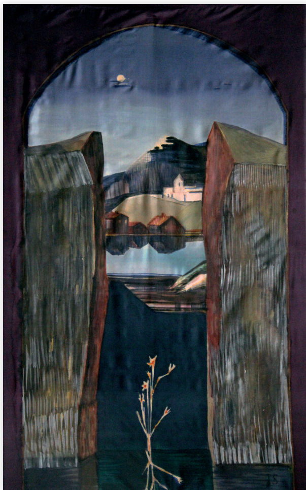
Skaty, 2014, jedwab 185x110