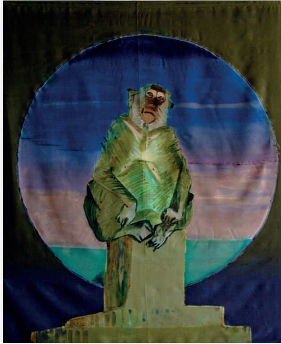
Małpa, 2012, jedwab 130x110