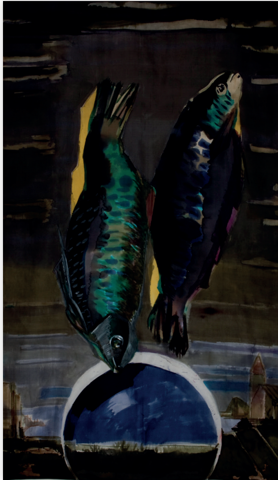
Ryby, 2012, jedwab 190x110