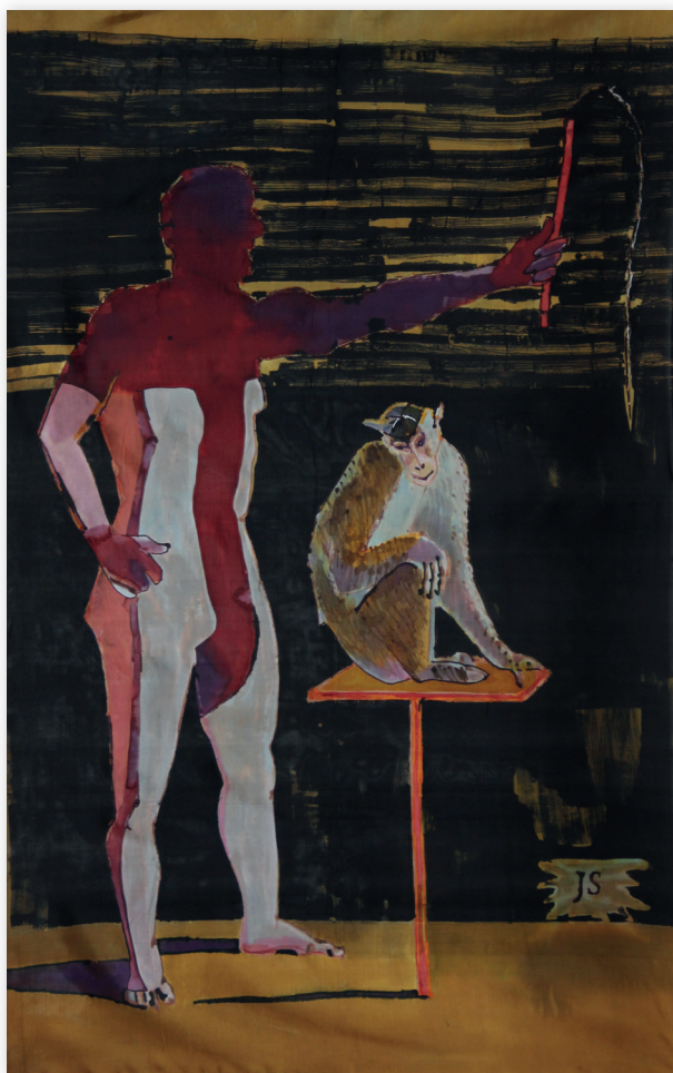
Treser, 2013, jedwab 175x113