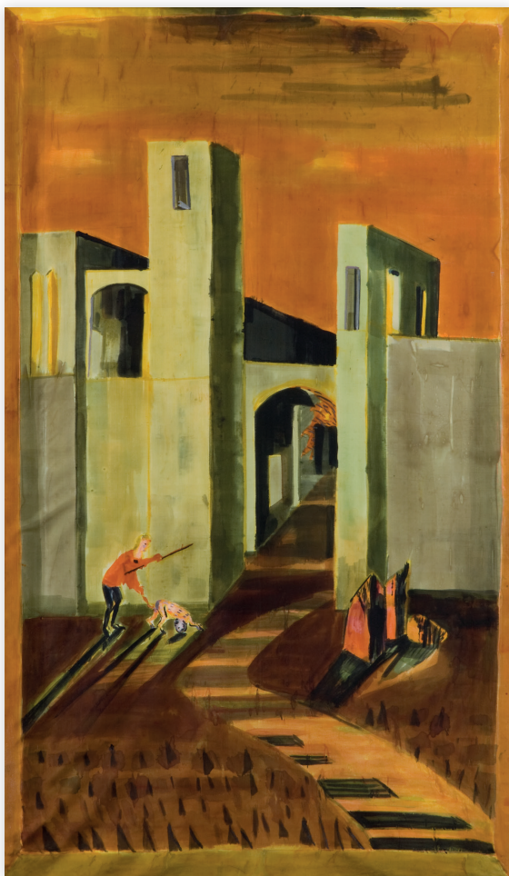
Człowiek z małpą, 2011, jedwab 185x110