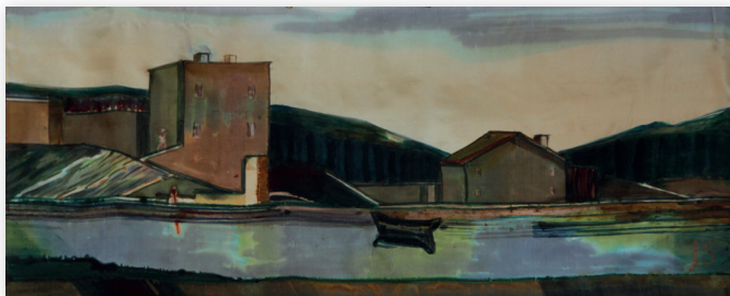
Impresja klasyczna, 2014, jedwab 50x110