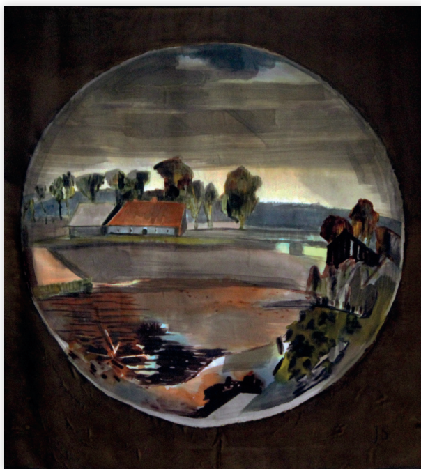
Sfera III, 2014, jedwab 110x110