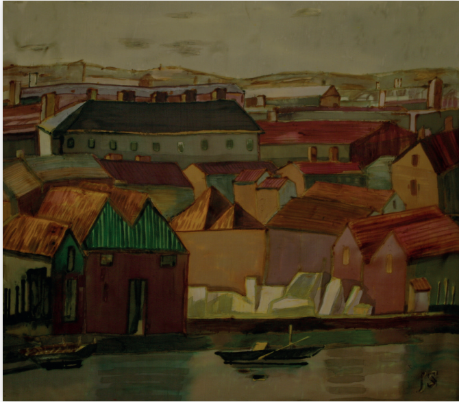
Pejzaż klasyczny, 2012, jedwab 105x115