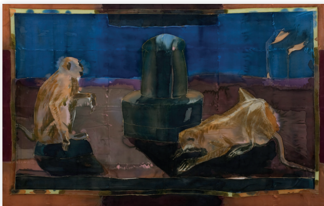
Linga z małpami, 2010, jedwab 104x174